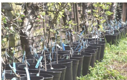
Certains bénévoles élèvent les scions en pots, la plupart en pleine terre

Merci de signaler si vous > participez au greffage > voulez élever des arbres