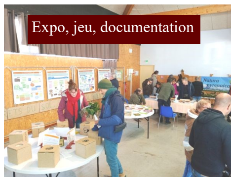
Expo, jeu, documentation