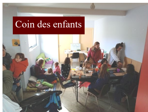
Coin des enfants