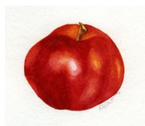
St Jean de Saleich* Rouge d'été de Mane