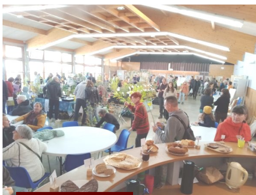
Des exposants dedans et dehors

La dernière manifestation de l'année a été un succès : la 10 ème édition a eu lieu sous le soleil, il semble que les visiteurs et les exposants aient apprécié la journée.