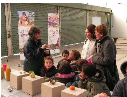
Animation avec une classe à Sauveterre

Le 12 novembre pour les plus grands et le 20 novembre pour les enfants de maternelle, nous avons proposé des ateliers sur le thème des fruits et les 5 sens. Nous nous sommes rendus compte que les enfants (et certains adultes) manquent des connaissances de base sur les fruits en général et nous avons proposé d'observer, goûter, tou-