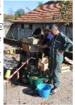
A la Fête de la Pomme à Larroque

Enfin si vous avez besoin de bouteilles et/ou de bouchons, faites-le nous savoir rapidement pour que nous puissions en commander. Il faut compter environ 0,50 € par bouteille en verre, qui peut être réutilisée chaque année.