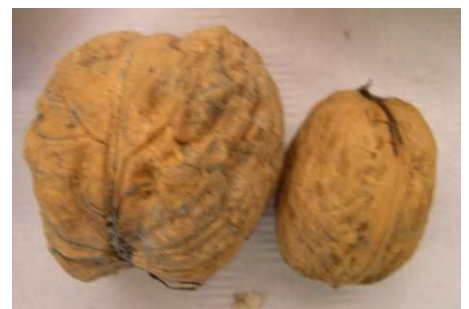
Noix à bijou et noix « normale »