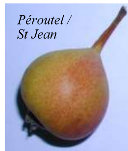
Péroutel / St Jean

Je peux envoyer une liste par courrier aux personnes qui n'ont pas Internet, n'hésitez pas à me la demander.