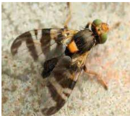
La coupable : Rhagoletis cerasi une petite mouche de 4-5 mm

A part la guigne et les variétés très précoces, toutes sont appréciées par la mouche du cerisier. Les pièges à phéromone sont une méthode de lutte efficace, à disposer vers la mi-mai, quand les insectes viennent pondre sur les fruits.