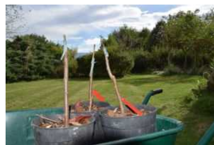
les 3 merisiers avant et après greffage