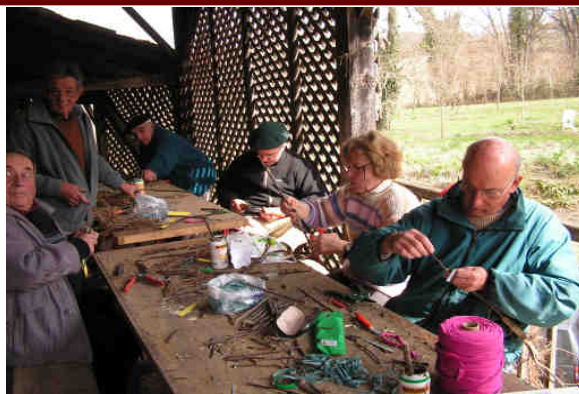
Les greffeurs en pleine action