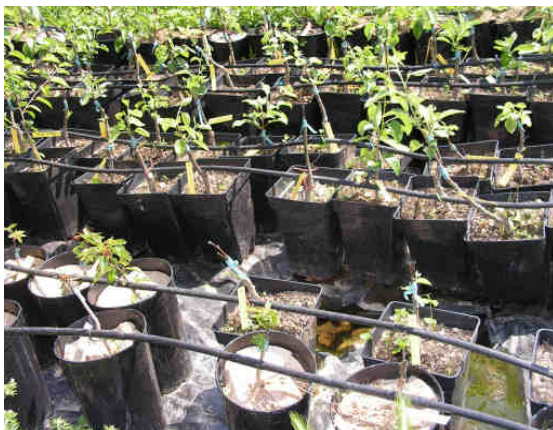
Une des pépinières de l'association

pata, bigarreau blanc, cerise madame,... et une quarantaine de pruniers (secrétaou juane, secrétaou noire, antonine,...) poussent aussi dans les pépinières.