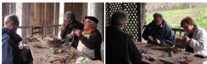
Greffage à Couret : concentration et application sont de rigueur !

La bourse aux greffons organisée le 3 mars à Boussens a été un succès : beaucoup de passionnés sont venus partager leurs connaissances, se renseigner et voir des démonstrations de différentes techniques de greffage. Beaucoup sont repartis avec des porte-greffes pour propager d'anciennes variétés locales ou ont greffé sur place avec les greffons que nous avons mis à disposition.