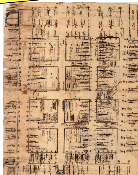
L'un des plans du jardin à Martres Tolosane

Appel aux volontaires pour organiser les permanences sur le stand ! Merci de vous manifester au 05 61 95 68 12