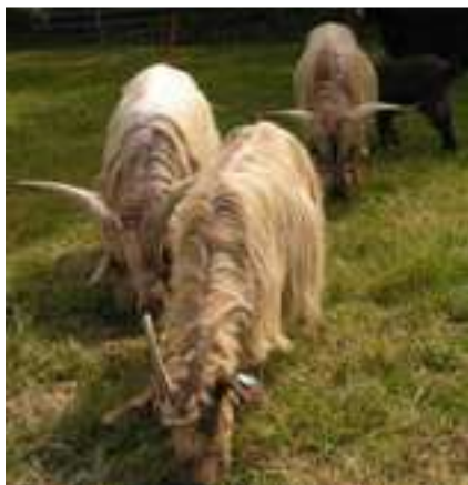
Chèvres de race pyrénéenne

Le public n'était pas au rendez-vous, mais des classes du Lycée Agricole ont pu être sensibilisées.